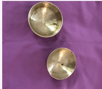
KANSU RELAX 1 heure 30 120 €