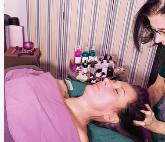
KOBIDO ET GUIR CHEVELU 1 heure 30 mn 180 €