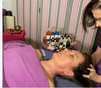
ANTISTRESS DU CRÂNE 1 heure 75 €