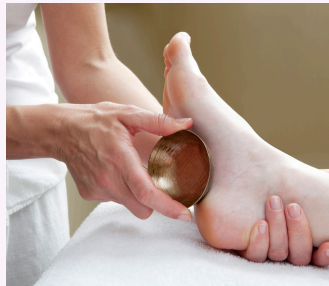
PIEDS AU BOL KANSU 1 heure 75 €