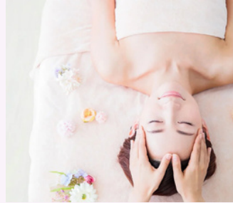
PETIT KOBIDO IMPÉRIAL 1 heure 30 mn 190 €