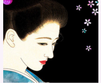
GRAND KOBIDO IMPÉRIAL 2 heures 240 €